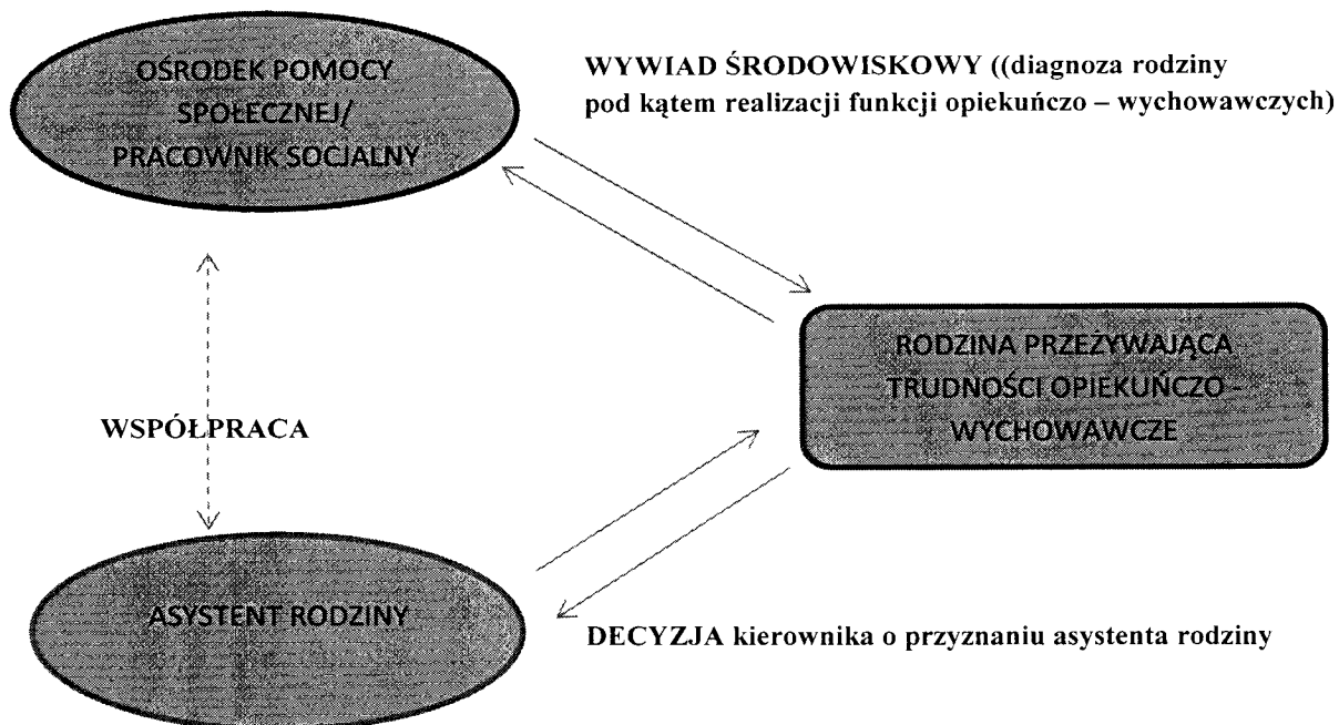
Rys. Nr 2 Gminny system wsparcia rodziny w kryzysie