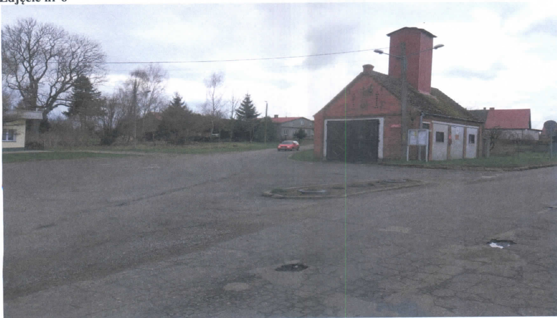
Zdjęcie nr 6