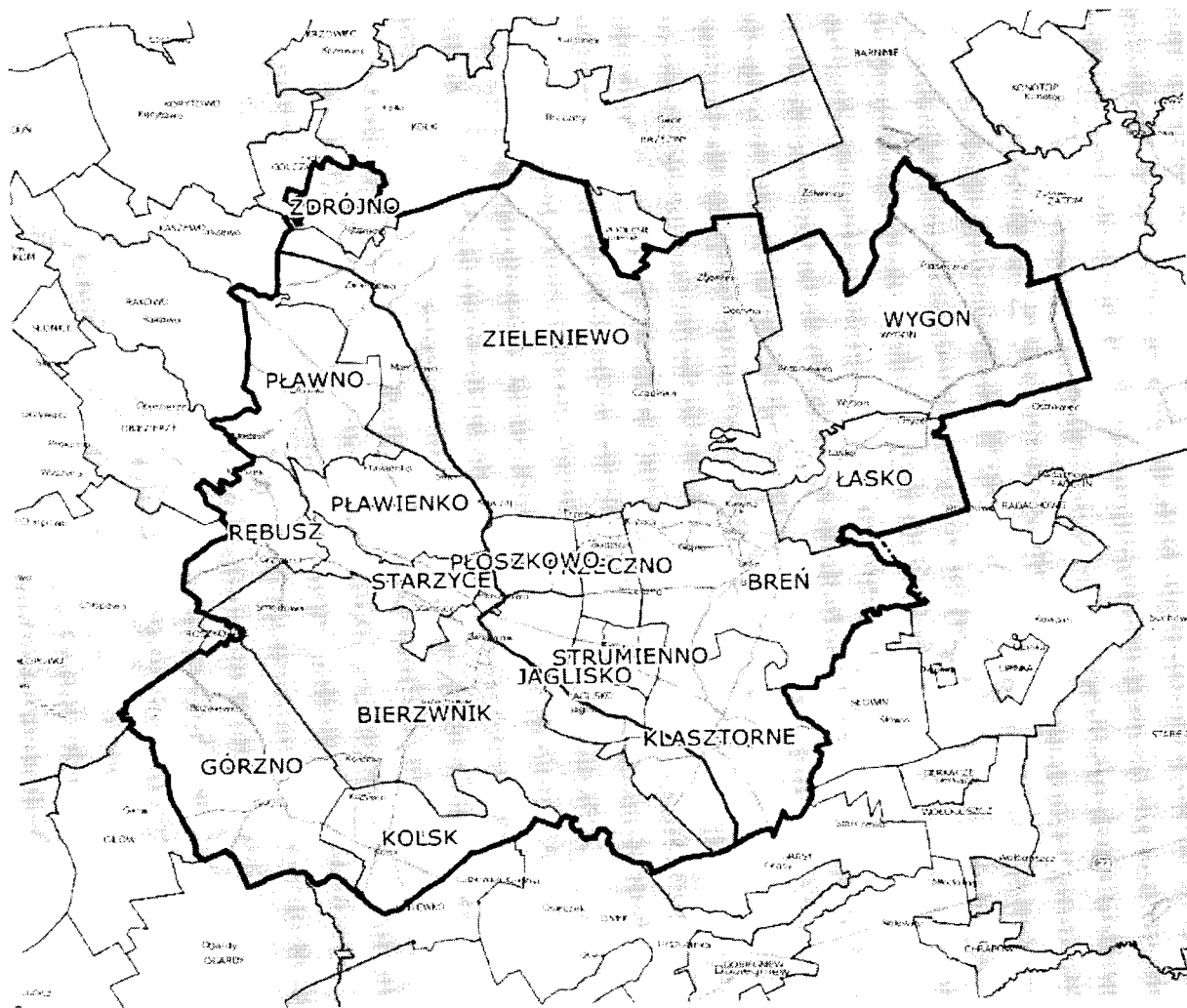
Rysunek 1. Sołectwa w gminie Bierzwnik

Gminę na stałe zamieszkuje 4685 osób (stan na 31.12.2019), to oznacza, że średnio przypada 20 os./km. Powierzchnia całkowita gminy to: 239,05 km 2 . Tereny leśne zajmują 53% powierzchni gminy, a użytki rolne 36%. Gmina stanowi 18% powierzchni powiatu choszczeńskiego. Aktualnie na terenie naszej gminy funkcjonują dwie stacje kolejowe: Rębusz i Bierzwnik. Przez gminę prowadzi droga wojewódzka nr 160, łącząca Bierzwnik z Choszczem (24 km) i z Dobiegniewem (11 km).